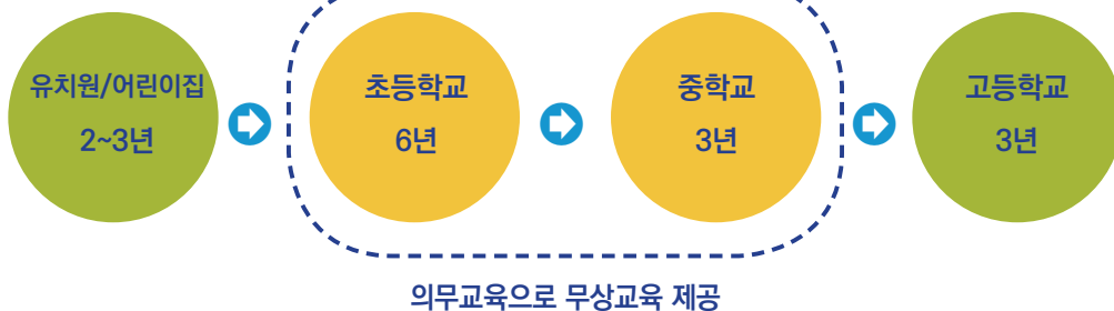
< 대한민국 학교교육 제도 >

※ 대한민국의 학교는 1학기가 3월부터 시작하며, 2학기는 8월 또는 9월에 시작, 주5일 수업을 진행하고 있음